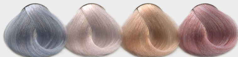
10g 12/11 + 1g BLEU