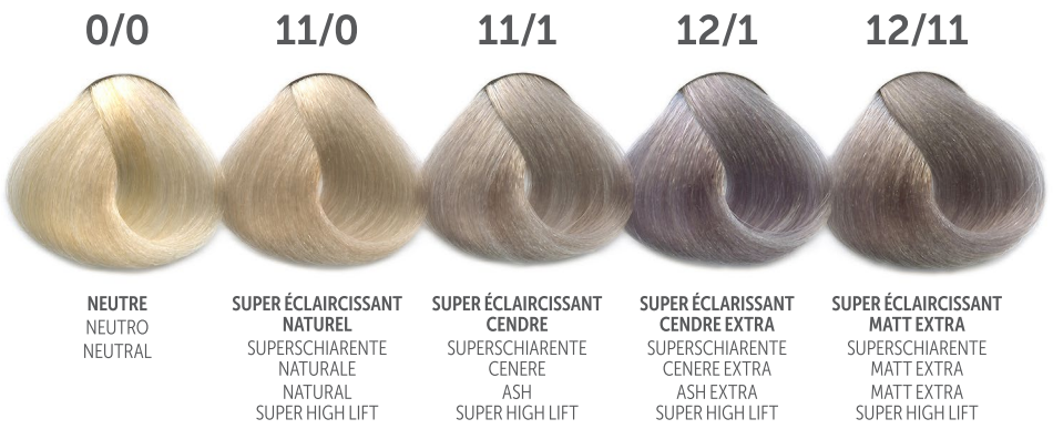
0/0 NEUTRE NEUTRO NEUTRAL