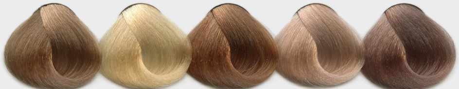
5g 8/3 + 5g 8/1