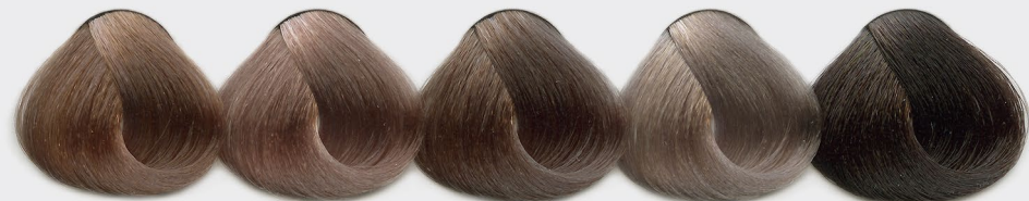
5g 8/1 + 5g 8/7