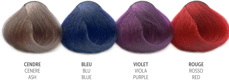
CENDRE CENERE ASH